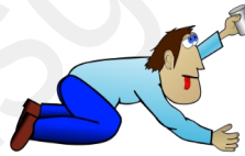
thirsty avoir soif