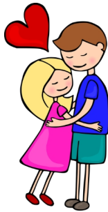
in love amoureux(se)