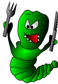
hungry avoir faim